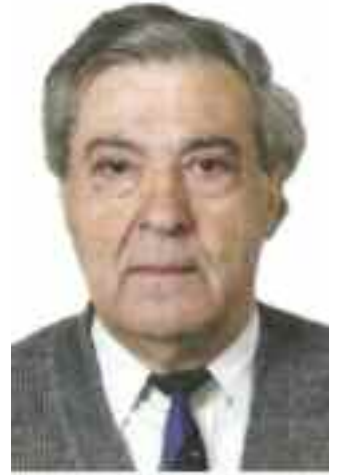
γων λογοτεχνών μας με μεγάλη προσφορά στα Ελληνικά Γράμματα και στην Ποίηση γενικότερα. Δεν γίνεται να είναι όλοι οι συγ-

τλώ και τους κανόνες της Εκκλησίας μας. Συνέχισε να «κατηφορίζει» και στάθηκε στην Αττική, όπου παρόμοιος κληρικός επέκρινε μητέρα, η οποία δεν συμφωνούσε με τη φυγή της κόρης της από το σπίτι, για να ζήσει με τον σύντροφό της και πιθανό σύζυγό της. Είπε κι άλλα πολλά. Κι εσείς τα ακούσατε... Δεν κράτησα πολλές σημειώσεις από την ωριαία ομιλία του, θυμάμαι, ωστόσο, ότι αναφέρθηκε υποτιμητικά στον συγγραφέα κ. Νίκο Δήμου τον οποίο αποκά-